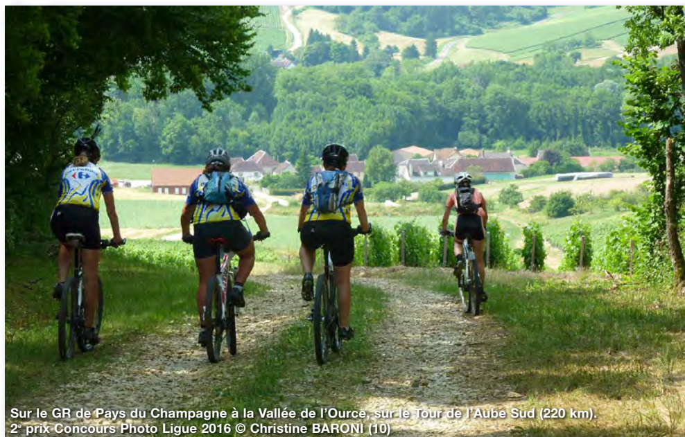
Sur le GR de Pays du Champagne à la Vallée de l'Ource, sur le Tour de l'Aube Sud (220 km). 2 e prix Concours Photo Ligue 2016 © Christine BARONI (10)

CYCLO CLUB RÉMOIS (00209) - Tél : 03.26.88.47.16