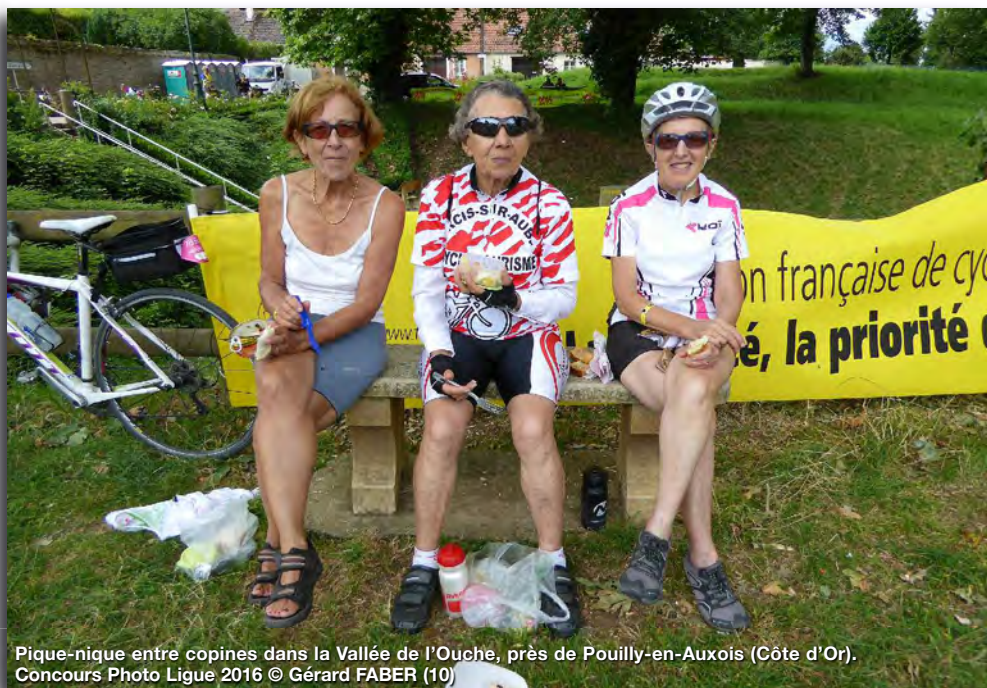
Pique-nique entre copines dans la Vallée de l'Ouche, près de Pouilly-en-Auxois (Côte d'Or). Concours Photo Ligue 2016 © Gérard FABER (10)