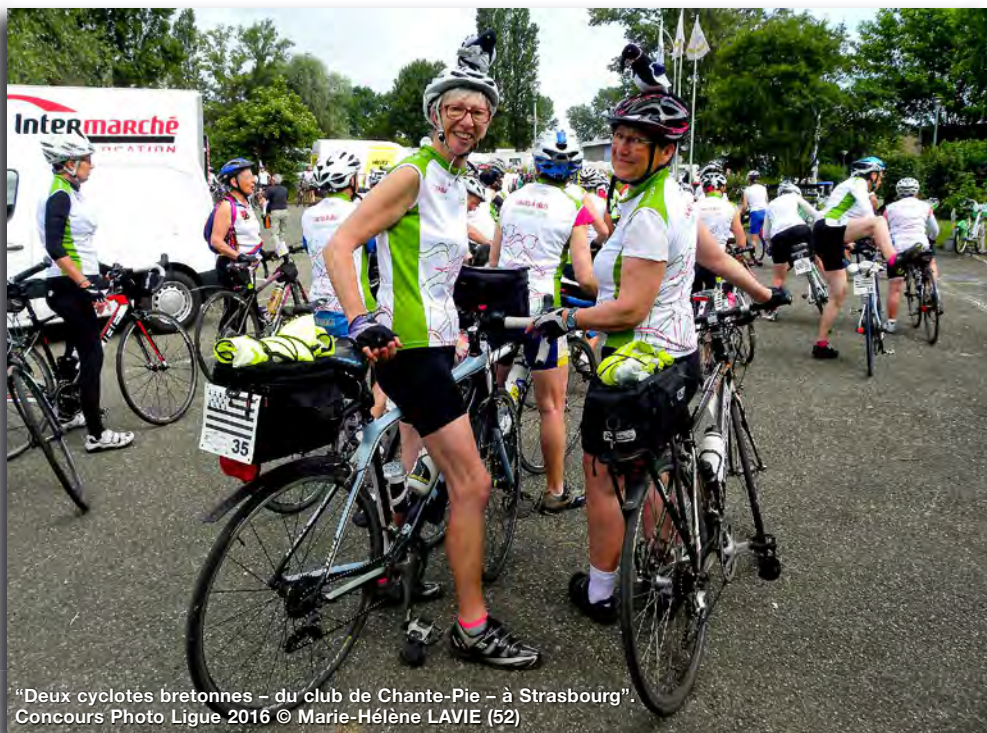
"Deux cyclistes bretonnes – du club de Chante-Pie – à Strasbourg". Concours Photo Ligue 2016 © Marie-Hélène LAVIE (52)